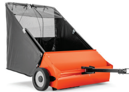
RASENKEHRMASCHINE 582 71 99-01