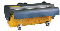
KEHRBÜRSTE 544 92 16-01