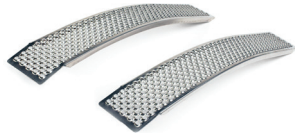
LADERAMPEN GEWÖLBT 505 69 90-41