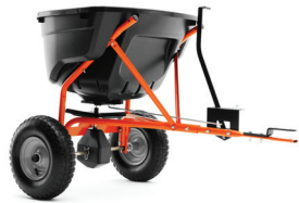
STREUWAGEN 75 967 02 72-01