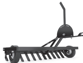
SCHOTTERHARKE 953 51 24-01