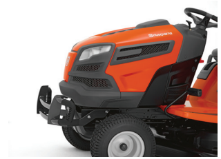
STOSSSTANGE MIT PFLANZENSCHUTZ 505 56 88-13