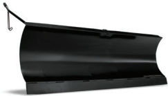
SCHNEERÄUMSCHILD 544 92 17-01