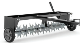
AERIFIZIERWELLE 586 63 69-01