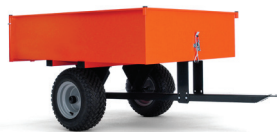
ANHÄNGER PROFİ 953 51 17-02