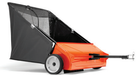
RASENKEHRMASCHINE 586 63 65-01