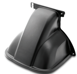
DEFLEKTOR 960 71 00-41