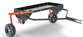
PLATTFORM 586 63 72-01