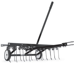
ENTMOOSER 586 63 66-01