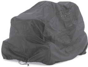
ABDECKPLANE 505 63 08-82