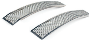
LADERAMPEN GEWÖLBT 505 69 90-43